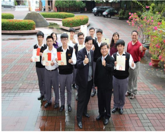
蒞臨文興高中舉辦股王競賽說明會及頒獎