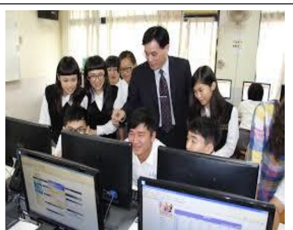
蒞臨文興高中舉辦股王競賽說明會