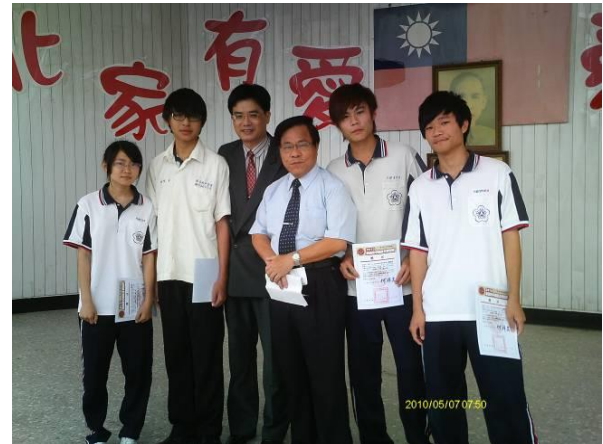
北斗家商頒獎（第一屆）