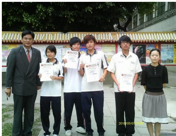
北斗家商頒獎（第一屆）