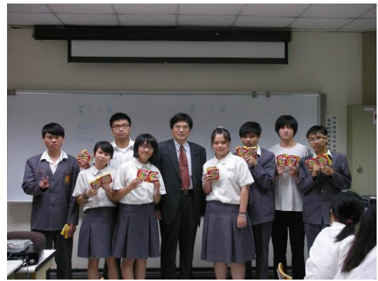
文興高中蒞臨大葉參加股王競賽說明會