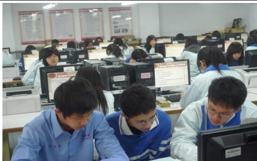
至明道高中辦理競賽操作說明會