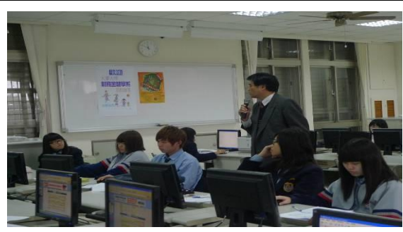
至宜蘭高商辦理競賽操作說明會