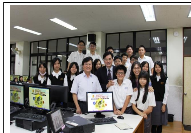
蒞臨文興高中舉辦股王競賽說明會