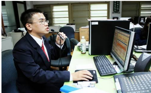
至中壢家商競賽操作說明會