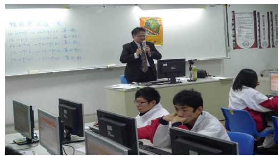
至治平高中辦理競賽操作說明會