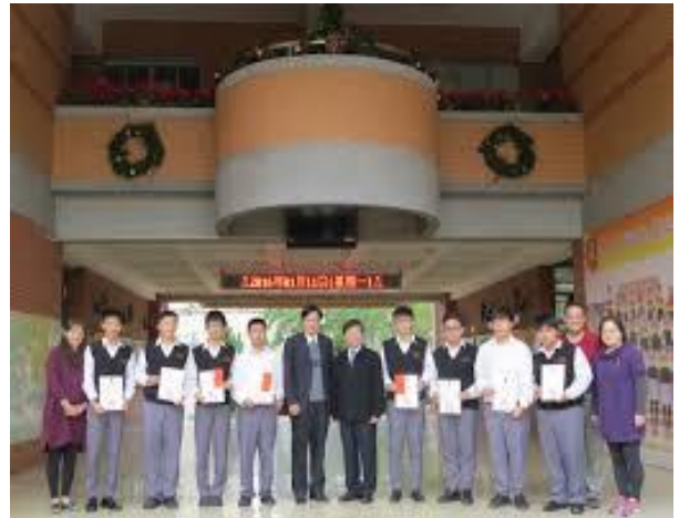
蒞臨文興高中舉辦股王競賽說明會及頒獎