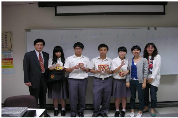
文興高中蒞臨大葉參加股王競賽說明會